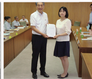
介護福祉人材の確保や道德教育の推進など重要政策提言を行いました