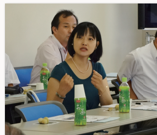
国家戦略特区に指定された養父市で高齢者雇用について意見交換

今年は「はるかぜの集い」もより幅広い方に参加していただけるように形式を変えて開催する予定です。また新たに不定期で共に学ぶ勉強会を設けてまいりたいとも考えています。今後も情報発信に取り組みながら、よりよい社会を次の世代に繋いでいけるよう活動してまいりますので、どうぞよろしくお願い申し上げます。