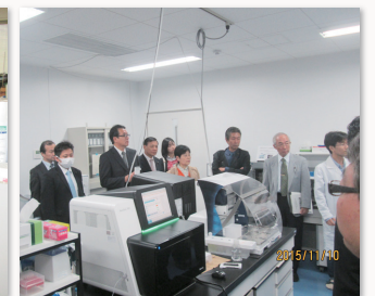
東北大学の東北メディカル・メガバンク機構の視察